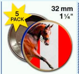
Der Button zum Cup!