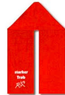
roter Fleece - Schal im starkem Trab und minimalistischem Dressurpferd.