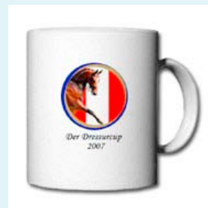
Der Cup zum Cup!

Alles für die schönsten Momente im Leben. Hier exklusiv ein feiner, Dressurcup 2007 - spezifischer Auszug aus der Produktpalette. Die Graphikmotive werden laufend aktualisiert. Für nähere Details besuchen Sie bitte den Online/Shop. Hier können Sie auch spezifische Designwünsche bekanntgeben.