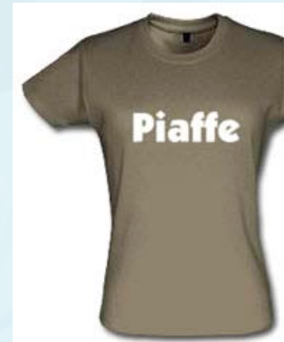
Pragmatisch und luxuriös zugleich: das perfekt sitzende Shirt für Ladies. - mit Dressurpferd - Zeichnung an Ärmeln.