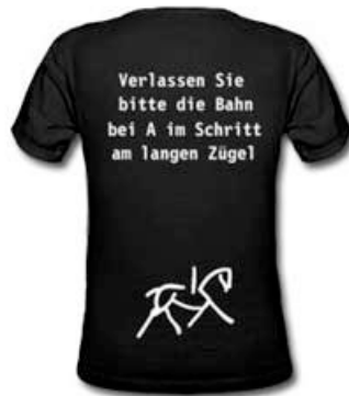
FoL - Shirt, mit direkter Anweisung