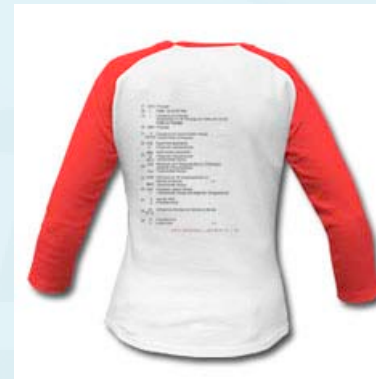
hervorragend verarbeitetes 3/4 -Arm -Shirt mit GP- Spezial Aufgaben zwecks „learning by heart“