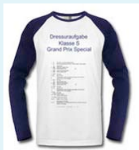
Raglan Langarm mit Auflistung der Dressuraufgabe Klasse S, GP spezial. Überschrift auch veränderbar.