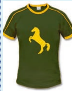
Retro - Shirt mit Kontrastnähten, 180 g / Bw, Topqualität