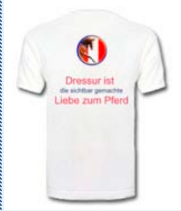
Dressurcup 2007, Dressur, aus Liebe zum Pferd schmal geschnitten, top Qualität