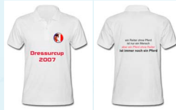
ultimatives Polo aus 160 g Bw. Dressurcup Logo 2007 sowie mit sinnfälligem Spruch am Rücken.