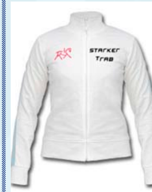
Sportjacke mit Reißverschluss von Hersteller Hanes. In trendiger Schrift im starkem Trab.