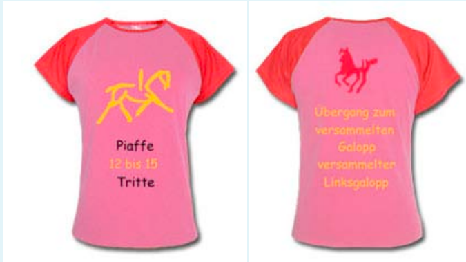
poppigtes Raglanshirt mit Dressurpferd - Abstraktion und Fohlen sowie einem kurzem Auszug aus einer Dressuraufgabe.