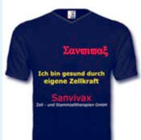
griech.: Sanvivax, Ich bin gesund durch eigene Zellkraft