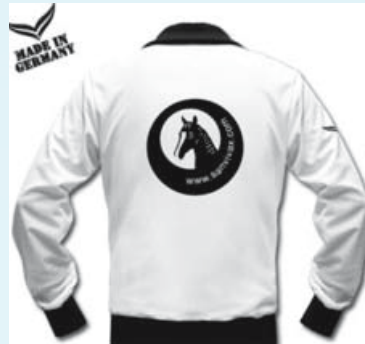
Trigema - Trainingsjacke, beste Qualität