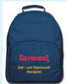
Rucksack, griech.: Sanvivax