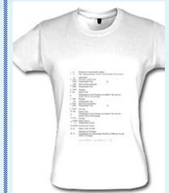
Klassiker mit Dressuraufgabe, im Zeitungsformat zum Vorlesen.