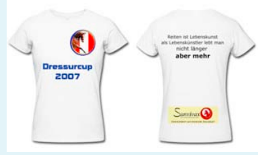
Dressurcup 2007, Lebenskunst Reiten